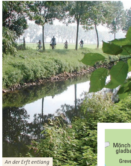
An der Erft entlang