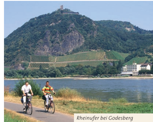
Rheinufer bei Godesberg